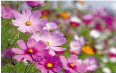
～今月の花の種～ コスモス