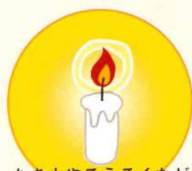
たき火やろうそくなど 最初のあかり Lighting1.0

従来の空間を明るくする機能だけではなく、「健康」「安全」「快適」「便利」という、4つのさらに進化した価値をもたらす照明を Lighting5.0 と総称しています。