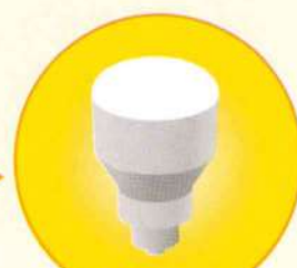
LED 照明 Lighting4.0