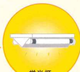
蛍光灯、 水銀ランプなど Lighting3.0