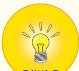
エジソンの 白熱電球 Lighting2.0