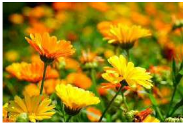
今月の花の種*キンセンカ

まきどき：8～11月 3～6月 はなどき：3～7月 7～11月 ※種まきの時期による